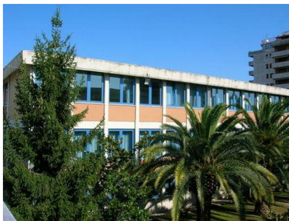
Il Plesso intitolato a Gaetano Spalvieri

In data 23.05.2009 il Plesso e la Direzione Didattica sono stati intitolati a Gaetano Spalvieri .